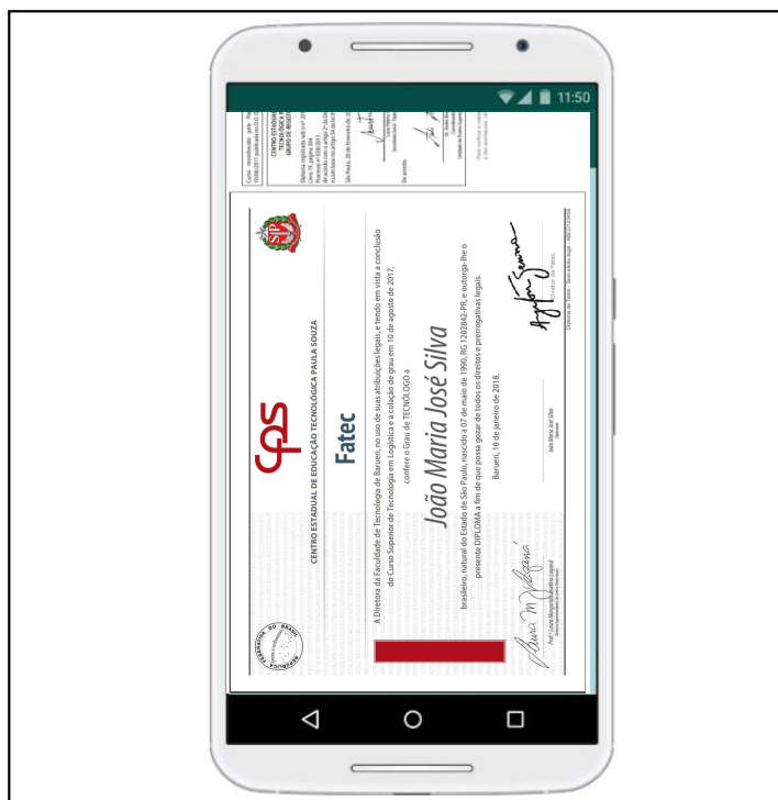
Figura 2 - Diploma recebido pelo aluno em um smartphone.

Você poderá validar as assinaturas e fazer o download fazendo a leitura do QRCode no verso. Para isso deve utilizar um aplicativo leitor de QRCode disponível em qualquer plataforma móvel.